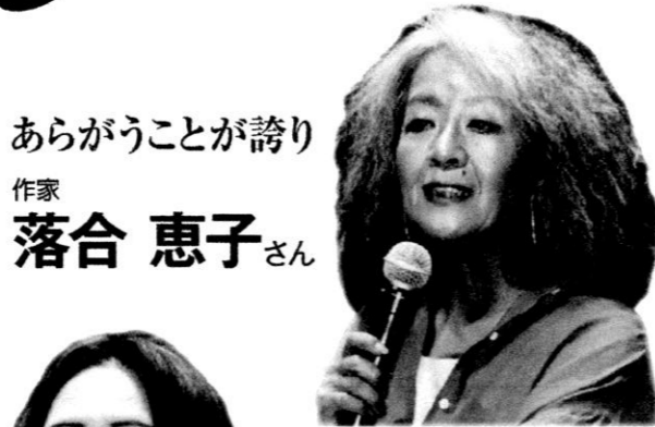
あらがうことが誇り 作家 落合 恵子 さん