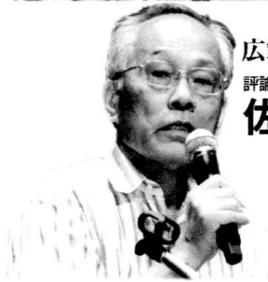
広範な勢力集めて 評論家 佐高 信 さん