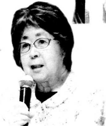
地殻変動起こして 精神科医 香山リカ さん